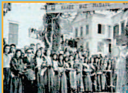
17/10/1944: από την υποδοχή των συμμάχων [2].

Στις 16 το βράδυ τα Αγγλικά αντιτορπιλικά «Τερψιχόρη» και «Κλήβελλαντ» αναχωρούν για την Κάρπαθο, όπου φτάνουν την Τρίτη 17 Οκτωβρίου. Αγγλικά στρατεύματα αποβιβάζονται στην Κάρπαθο, που γίνεται σταθμός των Συμμάχων εις τα Δωδεκάνησα και στορ-