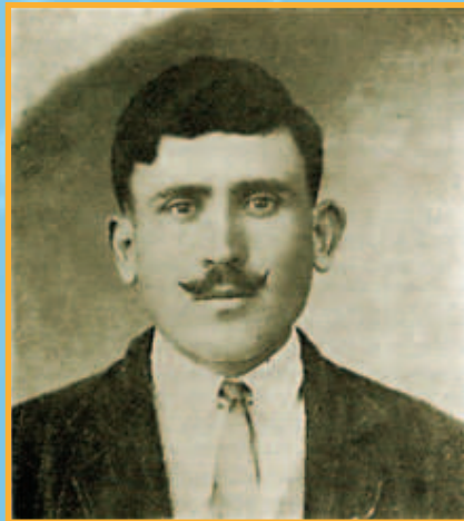
Ο Χριστόφορος Λυτός, κορυφαία φυσιογνωμία της Καρπαθιακής αντίστασης [15].

Ο Χριστόφορος Λυτός, κορυφαία φυσιογνωμία της Καρπαθιακής αντίστασης υπήρξε πραγματικά ήρωας [15]. Είχε χαρακτήρα