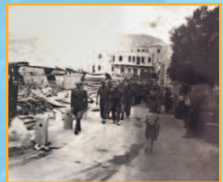
Γερμανοί στρατιώτες αποβιβάζονται στα Πηγάδια [13].

Στις 6 Σεπτεμβρίου του 1943 αποβιβάζονται