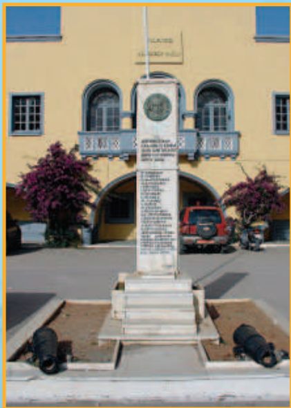
Το μνημείο των πεσόντων στο Επαρχείο Καρπάθου

Εμμετρος Απάντησις εις επιστολήν εκ Καρπάθου Γεωργίου Εμμ. Παναγιώτου (Μαστροπαναγιώτη) (Κρήτη, 1932)