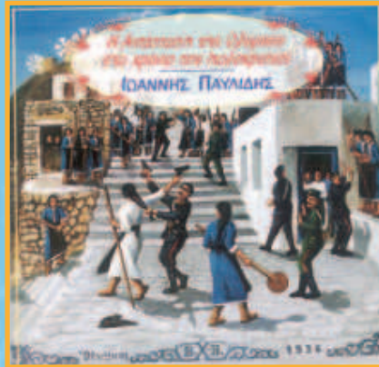
1936: Πάνω από χίλιοι κάτοικοι της Ολύμπου διαδηλώνουν εναντίον της Ιταλικής απογραφής [6].

14 επιστολές προς τις ελληνικές αρχές καταγγέλλοντας την καταπίεση και τους διωγμούς των Ιταλών κατακτητών. Αποκορύφωμα της δράσης του η επιστολή προς τον Πρόεδρο των Ηνωμένων Πολιτειών Woodrow Wilson το 1919! Μέσα από τις επιστολές αναδύεται ο φλογερός πατριωτισμός και η αγωνιστική διάθεση του σεπτού ιεράρχη, που βοήθησε να συντηρηθεί τό όραμα των Καρπαθίων.