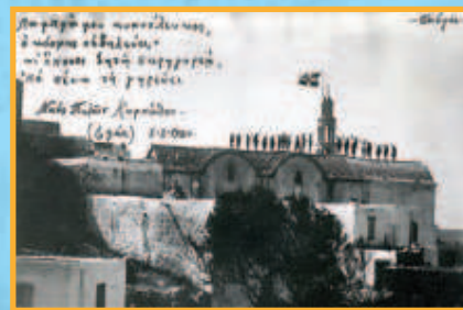
Μετά την συνθήκη των Σεβρών, σύσσωμη η Κάρπαθος απαιτεί την ένωση με την Ελλάδα. Εδώ οι κάτοικοι των Πυλών διαδηλώνουν την πίστη τους στην Ελλάδα [3].

«Λαμπρά μου κυανόλευκος, ο κόσμος σε ζηλεύει- κι όποιος ζητά παρηγοριά, 'πό σένα τη γηρεύγει».