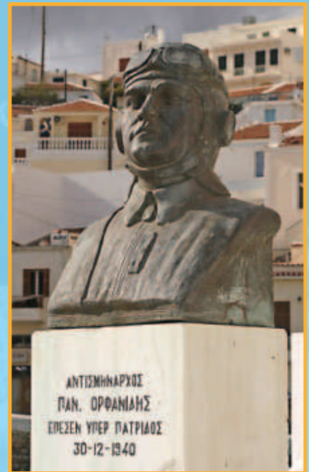
Η προτομή του Παναγιώτη Ορφανίδη στο Απέρι

Δωδεκανησίων εθελοντών υπό τον αξιωματικό συνταγματάρχη Κηλαδίκη. Γεμάτοι ενθουσιασμό αναχωρούν για τα ελληνοσερβικά σύνορα, στα στενά της Κέλλης και τα υψώματα της Βεύς. Στις 6 Απριλίου 1941, οι σιδερόφρακτες γερμανικές μεραρχίες, υποστηριζόμενες από χιλιάδες τόκνκς και αεροπλάνα, βρίσκουν σθεναρή αντίσταση από τους μαχόμενους Δωδεκανησιούς. Ψάλλοντας τον Δωδεκανησιακό ύμνο, σταμάτησαν τον εχθρικό χείμαρρο, που ανακάστηκε να παρακάμψει τα στενά της Κέλλης και να εισβάλλει δια μέσου της Κοζάνης [12].