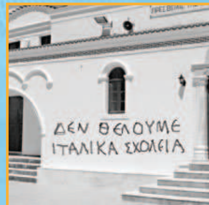
Φωτογραφική αναπαράσταση του συνθήματος του Β. Οικονομίδη.

«Ο Ντε Βέκκι (1937) ήταν ο σκληρότερος Διοικητής που πέρασε από τα Δωδεκάνησα. Αυτός ήθελε να εξιταλίσει τα νησιά ει δυνατόν εντός 24 ωρών, ενώ ο προκάτοχος του, ο Μάριο Λάγκο πολιτικός, διπλωμάτης κι αυτός εφήρμοζε το σύστημα του, κατά τρόπο ήπιο και μαλακό, χωρίς να προκαλεί αντιδράσεις του πληθυσμού. Δηλαδή «μας ξύριζε με το μπαμπάκι» όπως λέγει ο κοσμάκης, ενώ ο Ντε Βέκκι -σου λήξει- από το 1912 μέχρι το 1936, είκοσι τέσσερα χρόνια που είναι οι Ιταλοί εδώ δε μιλάνε ιταλικά, διδάσκεται η ελληνική γλώσσα -τα κατήργησε όλα αυτά- και η δράσις αυτή του Ντε Βέκκι, έφερε φυσικά και την αντίδραση».